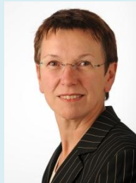
Martina Hoff- mann-Badache , Staatssekretärin im MGEPA NRW