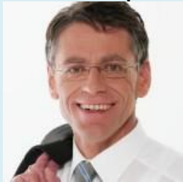
Hans-Jürgen Petrauschke , Landrat